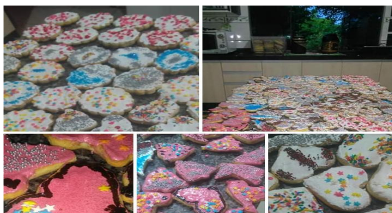
Figura 11 - Bolachas para “moeda de troca”