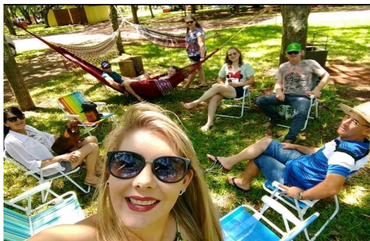
Figura 9 - Onze horas e sua família