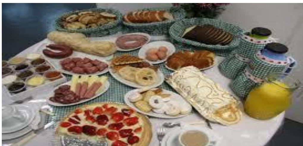
Figura 3 - Café Colonial