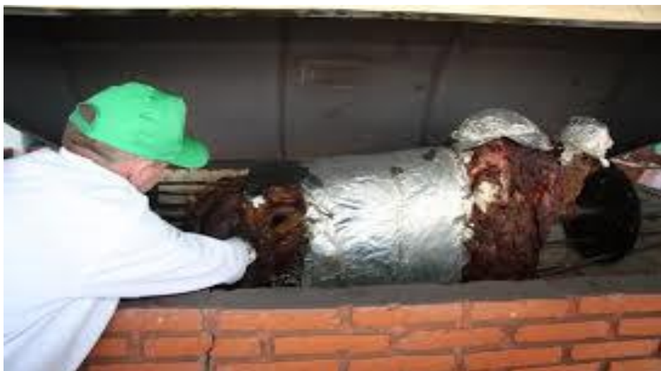
Figura 4 - Festa Nacional do Boi no Rolete