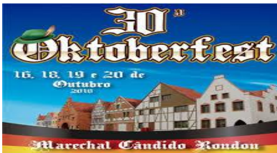
Figura 5 - Cartaz da Oktoberfest