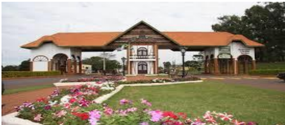
Figura 2 - Portal de entrada, município de Marechal Cândido Rondon – PR

intuito fazer de Marechal Cândido Rondon, “a cidade mais germânica do Paraná” (STEIN, 2000, p. 5).