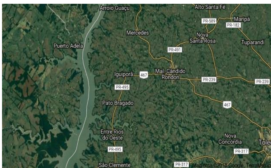
Figura 1 - Mapa do município de Marechal Cândido Rondon- PR.

A pesquisa foi realizada em Marechal Cândido Rondon que se localiza no extremo Oeste do Paraná (Figura 1). Município foi colonizado por descendentes de imigrantes vindos do Rio Grande do Sul e Santa Catarina, em meados dos anos 1950, atraídos pela política de incentivo e expansão da fronteira agrícola na região. Sua população é de 52.379 habitantes, sendo que a maior parte (83,61%) habita na área urbana, segundo o IBGE (2010). A colonização por descendentes alemães que se destaca, o que faz com que a cultura do município esteja muito enraizada na identidade germânica, a língua alemã ainda é falada e conservada pelos moradores mais antigos da cidade, o que se mostra nas festas locais, na gastronomia e hábitos da população e também na própria arquitetura da cidade (Figura 2).