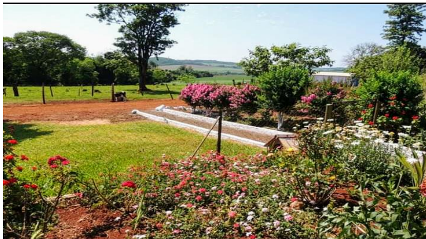
Figura 10 - Jardim “minha terapia”, de Rosa do Deserto