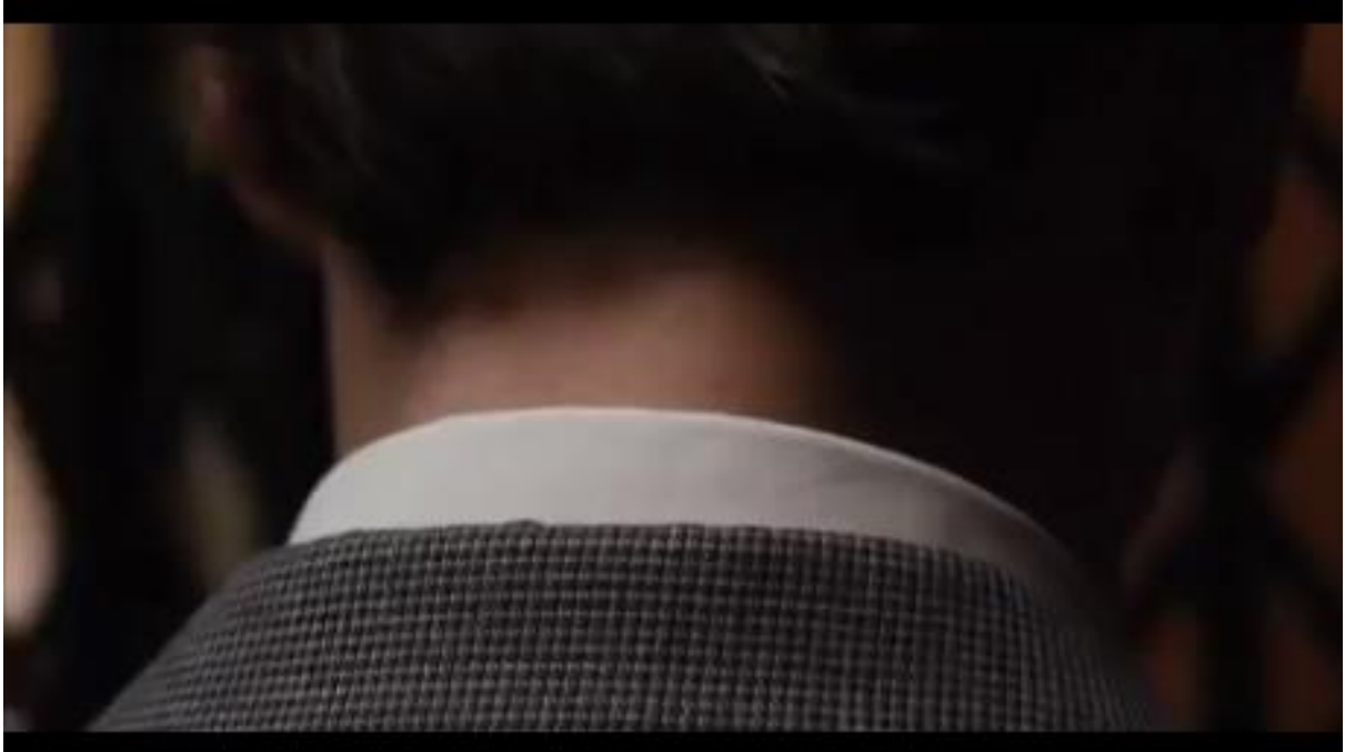
Imagem 33 - Colarinho (2004 - 20' 43") Fonte: La niña santa (2004)