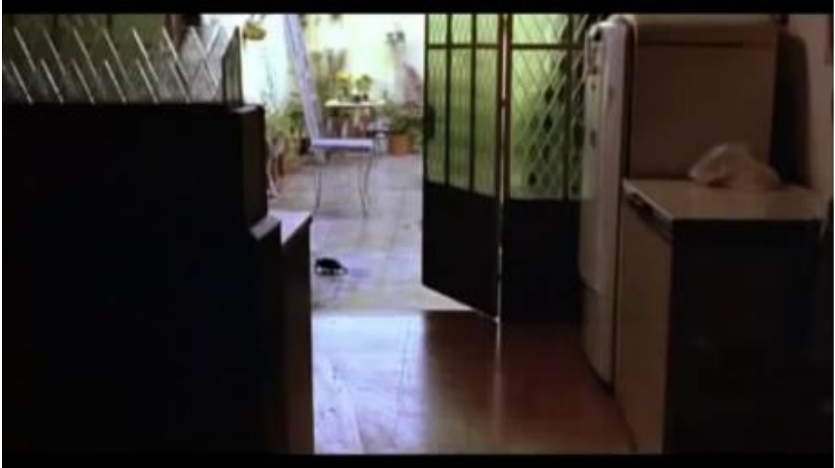
Imagem 15- Vazio (2001 - 01 30' 23") Fonte: La ciénaga (2001)

As questões de descentralização e abandono do foco ao visual também estão presentes nos outros dois longas-metragens, La niña santa e La mujer sin cabeza . Os ambientes superlotados, usados constantemente, propiciam esse efeito; no segundo filme da cineasta argentina é permanente tal sensação, uma vez que a narrativa se produz, quase exclusivamente, num hotel, local em que a família de Helena vive com alguns dos empregados da hospedaria. A filmagem, a posição da câmera de forma mais específica, na produção das tomadas, enfatiza locais apertados e cheios de objetos, com uso frequente de primeiros planos - imagens 16 e 17. A primeira se passa em uma sala de aula que, apesar de referenciar um local maior, na imagem apresentada as alunas estão todas muito próximas, dando a sensação de aperto. Já na segunda imagem, o local da tomada é a rua, ambiente em que há muito espaço, contudo, a câmera prioriza um foco em que muitas pessoas estão aglomeradas, comunicando a mesma ideia de um local asfixiante.