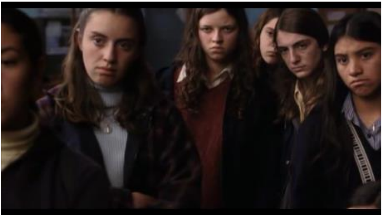
Imagem 32 - La niña santa (2004 - 01' 41") Fonte: La niña santa (2004)

Em La niña santa , a primeira imagem de cena que aparece é de algumas meninas dispostas em perspectiva e a personagem Amalia está ao fundo e ao centro. Têm-se aí o narrador primeiro apontando o olhar do espectador para quem terá um dos focos narrativos mais intensos desta diegese (imagem 32).