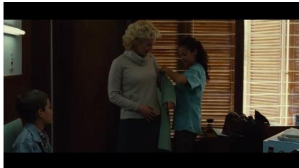
Imagem 19 - Assistente (2008 - 26' 01'')

Lucrecia Martel posiciona sua câmera de forma que os corpos não apareçam em sua totalidade, isso é constante em seus longas-metragens. O que se vê são partes específicas, como na imagem 18, e percebe-se que não há uma preocupação em torno desse fato, há sim uma intenção; pode-se dizer que há um propósito em deixar visível que o sujeito não é um ser completo, mas sim a união de várias partes; que as identidades não são fixas e estáveis e que, se assim fosse, o ser humano não se transformaria nas várias possibilidades que estão disponíveis. A construção do homem pós-moderno se dá na junção dessas alternativas que estão na sociedade, que não preza pelo homogêneo, tampouco pela unicidade que oferece.