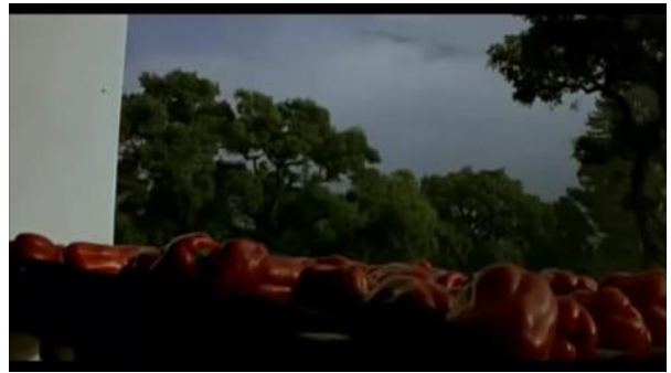
Imagem 23 - Telhado (2001 - 31'')