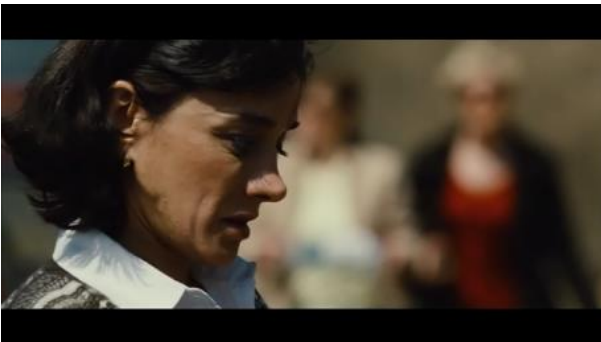
Imagem 33 - Quem vai falar (2008 - 02' 46") Fonte: La mujer sin cabeza (2008)

narrativo escolhido pelo narrador primeiro, até que a câmera focaliza Verô retirando uma criança de seu carro e passa a voz narrativa para ela (imagem 34).