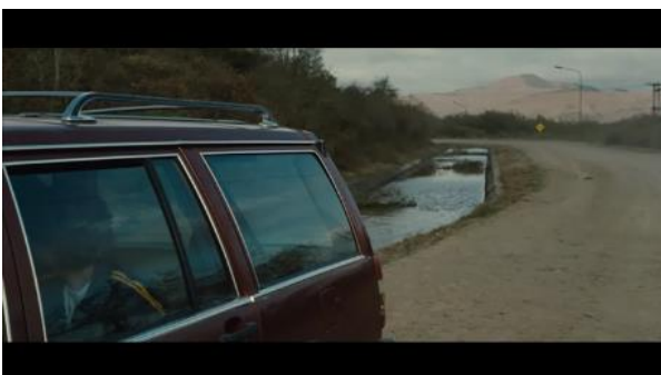
Imagem 67- Canal (2008 - 37' 01'')