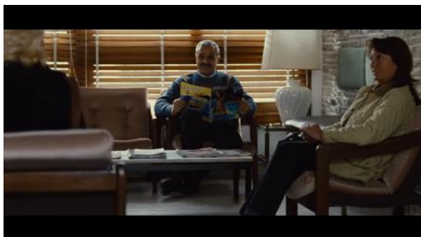
Imagem 18 - Consultório (2008 - 25' 22'') Fonte: La mujer sin cabeza (2008)

fragmentada e embaralhada e não consegue voltar para sua vida, perde a identidade e seus referenciais. Tal situação é representada pela cena que demonstra que ela precisa retornar ao trabalho - consultório de odontologia -, mas, ao chegar ao local, dirige-se à sala de espera e senta-se, como se fosse um paciente. Permanece ali até que uma de suas assistentes a chama, preparando-a para já atender. Verô não consegue se conectar à realidade ao seu entorno (imagens 18 e 19).