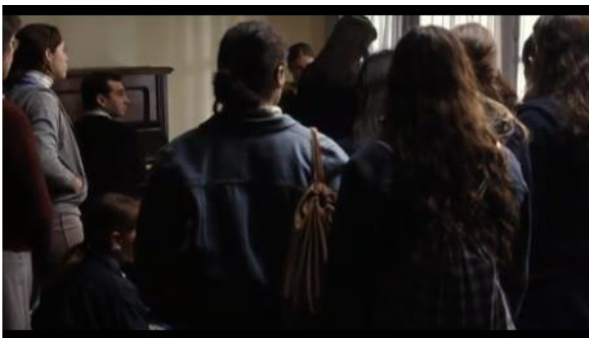
Imagem 21 - A visão de uma criança 2 (2004 - 02' 13") Fonte: La niña santa (2004)