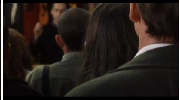
Imagem 79 - Nucas (2004 - 55' 00")

Em La niña santa , a influência do ponto de vista segue por um caminho tátil. Na imagem acima, a impressão que se tem é que, além da mão do Dr. Jano, a mão do espectador também poderá tocar a menina. Mais uma vez a câmera induz a percepção de quem vê a cena. Ademais de não ser uma imagem rápida, ela demora, do início ao fim, vinte e oito segundos, intercalado por uma segunda imagem (imagem 78), em que ambas as personagens são focalizadas de costa, exatamente no mesmo ângulo que Jano via a jovem, como se o espectador fosse alguém que estivesse atrás de médico, fazendo a mesma coisa que o doutor fazia em Amalia .