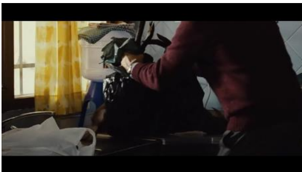
Imagem 64 - Animal (2008 - 22' 29'') Fonte: La mujer sin cabeza (2008)

Contudo ele não é o único, pequenos fatos de outros fios narrativos ocorrem e contribuem para que o espectador se sinta em meio ao turbilhão de pensamentos, que é a cabeça da protagonista.