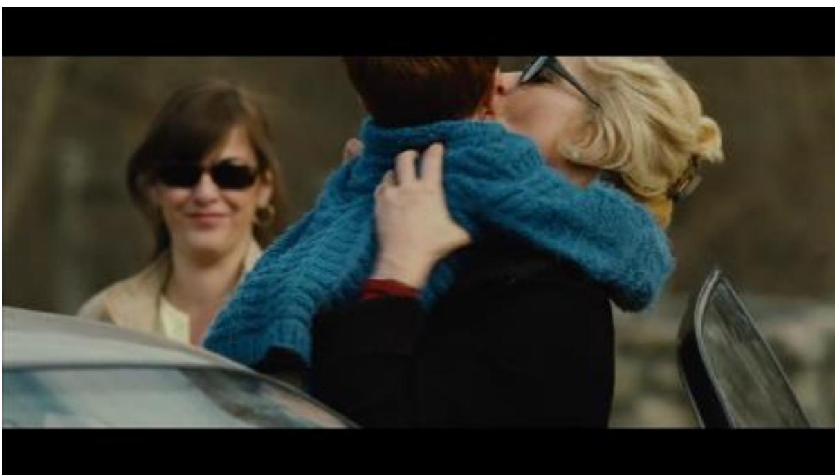
Imagem 34 - Blond girl (2008 - 03' 56") Fonte: La mujer sin cabeza (2008)

O narrador pós-moderno que Silviano Santiago apresentou no final dos anos 1980 traz um conceito que Walter Benjamin já havia apresentado em seu texto “Experiência e pobreza”, algo muito próximo ao escritor contemporâneo quando afirmou que relacionar fatos do passado não quer dizer que realmente os viveu ou os