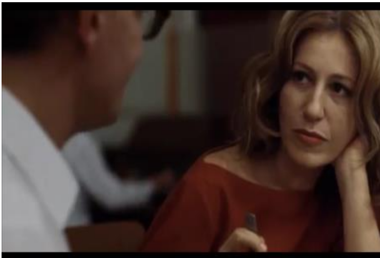
Imagem 59 - Olhar 4 (2004 - 43' 11")