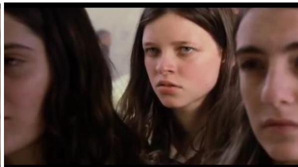
Imagem 53 - Amalia 3 (2004 - 10'27")

Tal ponto de vista é do narrador primeiro, aquele que mostra a cena e direciona o olhar do espectador, e a forma como se exhibe não é inocente, ele influencia a visão, modifica a compreensão e determina a percepção. Neste filme, o posicionamento da câmera está mais fechado que no anterior, enfocando mais o olhar da personagem ou do narrador primeiro, o que resulta na aparição, recorrente, de ambientes claustrofóbicos (imagens 54 e 55).