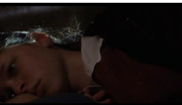
Imagem 55 - Amalia 4 (2004 - 12' 39")