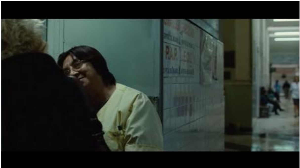
Imagem 63 - Formulário (2008 - 10' 22") Fonte: La mujer sin cabeza (2008)

Na cena do Raio-X não há diálogo, pois ali está somente Verô, contudo, ouve-se uma fala “a senhora está dormindo”, esta conversa faz parte da próxima cena (imagem 62) em que uma mulher que aguarda atendimento fala a outro paciente. A situação de fala que se adianta à imagem é característica do pensamento e é mais um artifício para representar a condição psíquica da personagem principal. Não se pode deixar de citar que, mais uma vez, é uma cena no escuro, que se vê somente os contornos das pessoas e dos objetos, o que não deixa de sugerir que é assim que a cabeça de Verô se encontra, na penumbra, situação que se repete muitas vezes na primeira parte do filme.