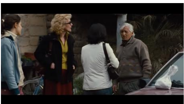
Imagem 66 - "Chango" (2008 - 54' 58'')

Como Verô não desceu do carro para prestar socorro ao atropelado, ela não sabia o que havia se chocado contra o veículo. O narrador primeiro, com seu poder de direcionar o olhar do espectador, joga com a possibilidade de ter sido um animal ou uma pessoa. Verónica encontra-se nessa constante alternância de sua vítima (imagens 64 e 65). Ninguém sabe o que ocorreu, exceto ela, portanto todos os outros fios narrativos tratam de assuntos que estão indiretamente relacionados ao acidente. A ida ao vendedor de vasos e a falta de um funcionário (imagem 66), a parada à beira da estrada para pegar o tênis do sobrinho que foi atirado pela janela e a presença do canal cheio d'água (imagem 67), a passagem pelo resgate de alguma coisa no canal pelos bombeiros (imagem 68), a presença fantasmagórica de imagens de crianças (imagem 69), tudo remete ao acidente, mas não de forma clara e objetiva.