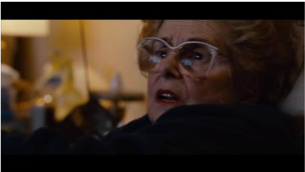
Imagem 70 - Tia Lala (2008 - 34' 31") Fonte: La mujer sin cabeza (2008)