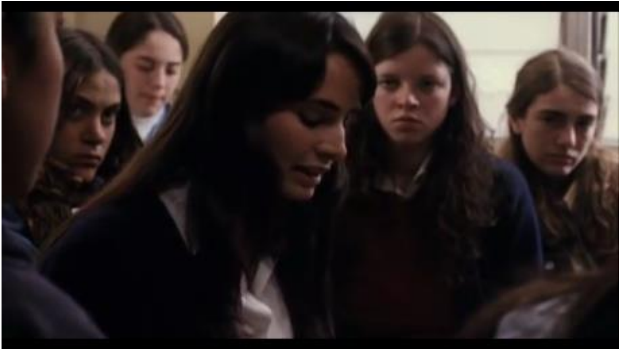
Imagem 16- sala de aula (2004 - 06' 23") Fonte: La niña santa (2004)