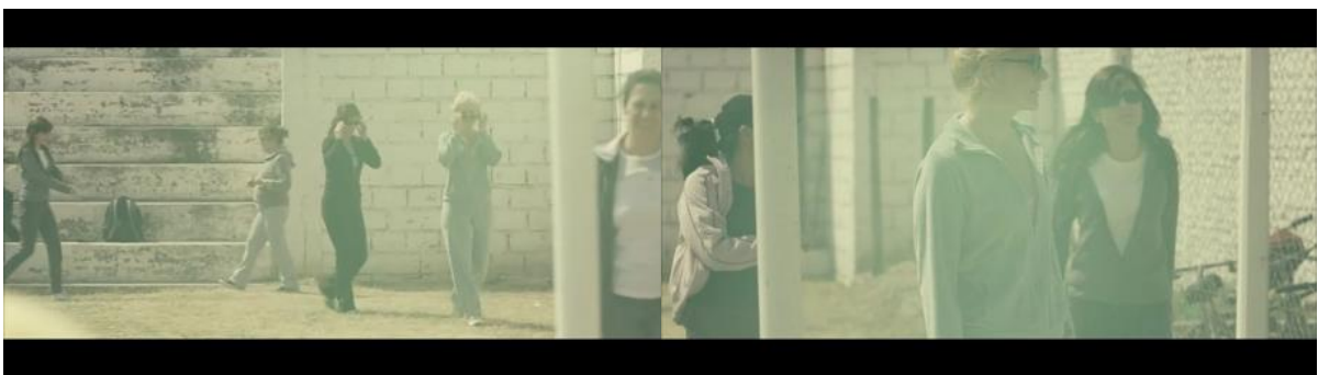
Imagem 38 - Sonho 1 (2008 - 37' 29")