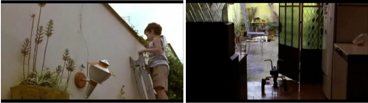
Imagem 31 - Luciano (2001 - 01' 31' 23" e 01' 31' 46") Fonte: La ciénaga (2001)

Em La niña santa , a primeira imagem de cena que aparece é de algumas meninas dispostas em perspectiva e a personagem Amalia está ao fundo e ao centro. Têm-se aí o narrador primeiro apontando o olhar do espectador para quem terá um dos focos narrativos mais intensos desta diegese (imagem 32).