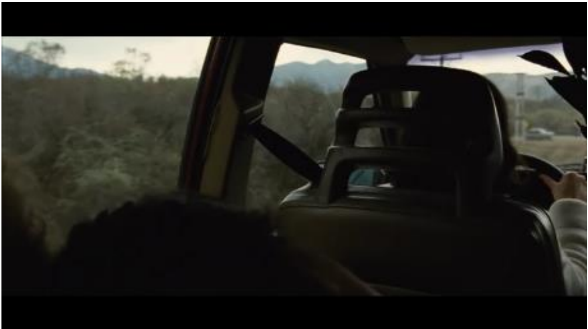
Imagem 34 - Janela (2008 - 01 29' 11") Fonte: La mujer sin cabeza (2008)