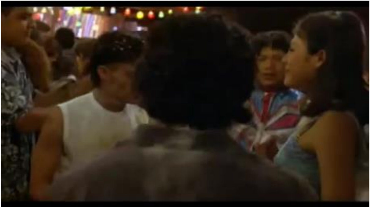
Imagem 30 - Baile de carnaval (2001 - 42' 42") Fonte: La ciénaga (2001)

Essas pequenas narrativas aparecerão durante toda a diegese, nos três filmes. O exemplo acima é só uma forma de ilustração da ocorrência metadieética constante.