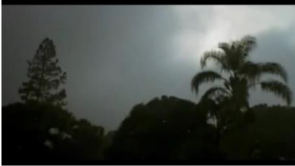
Imagem 22 - Sol (2001 - 24'') Fonte: La ciénaga (2001)