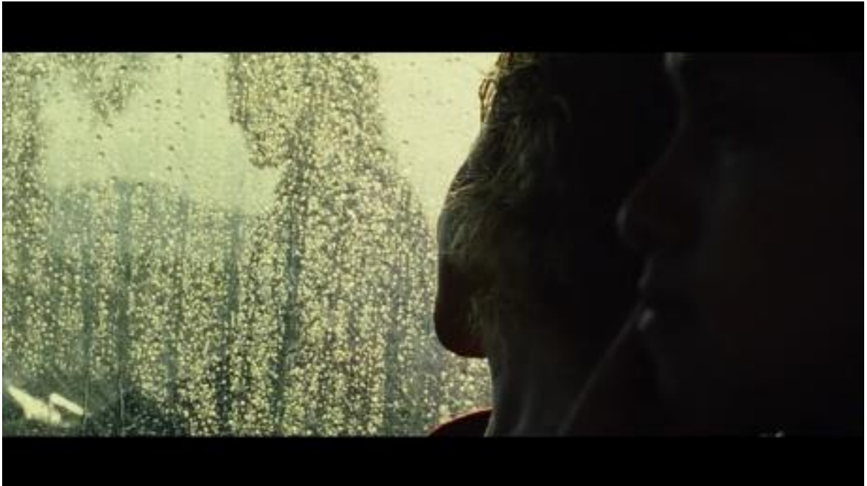
Imagem 60 - Vulto (2008 - 07' 55") Fonte: La mujer sin cabeza (2008)

Após o acidente, Verô arranca com seu carro sem olhar para trás, como se nada tivesse acontecido. Algum tempo depois para o carro, desce e fica andando de um lado para outro, começa a chover, a cena corta e a imagem seguinte é da personagem dentro de um carro, no banco do carona, há um motorista, mas ambos os rostos estão no escuro, o que se vê são seus contornos, Verô está mentalmente no escuro. Ela olha pela janela, que está cheia de pingos de chuva, e vê o contorno disforme de uma pessoa, como uma sombra, eis que o acidente começa a assombrá-la . A posição da câmera sugere o narrador primeiro, aquele que direciona o olhar do espectador e manipula sua percepção dos fatos. Este narrador constrói o ponto de vista sobre a personagem Verónica e sua condição, o incidente não é o foco, mas sim o que ele causou à protagonista.