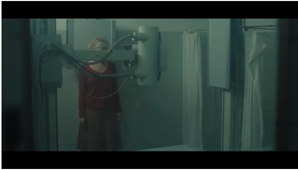
Imagem 61- Raio-X (2008 - 09' 39") Fonte: La mujer sin cabeza (2008)