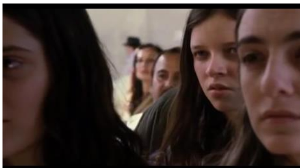
Imagem 52- Amalia 2 (2004 - 10' 24") Fonte: La niña santa (2004)

Nas imagens 52 e 53 vê-se Amalia. Nessa cena, a câmera não representa o olhar de outra personagem, mas sim o narrador primeiro influenciando o olhar do espectador sob a protagonista. Aqui se tem um aglomerado de pessoas assistindo uma apresentação musical em uma vitrine de loja de instrumentos, a câmera mostra uma imagem fechada, tem-se a impressão de aperto, Amalia está parcialmente escondida e na sombra; na imagem 52, todo seu rosto aparece e está iluminado, sugerindo que ela é uma pessoa iluminada , com uma missão divina. Lembra-se que este filme apresenta uma visão sobre questões religiosas, pois o colégio que as adolescentes frequentam é religioso.