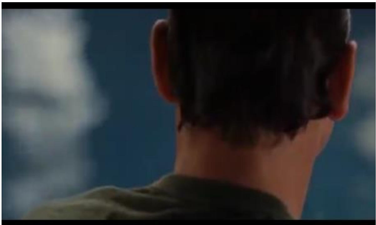
Imagem 57 - Olhar 2 (2004 - 13' 40") Fonte: La niña santa (2004)