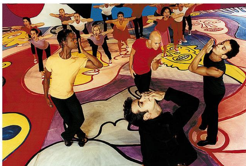
Imagem 3 - Povinho - 4 x 4 Fonte: Deborah Colker (1999)

Deborah Colker, brasileira, pianista, bailarina, coreógrafa, diretora de movimento e envolvida com uma diversificada gama de afazeres artísticos, em sua obra 4 por 4 24 traduz, visualmente, o que Hutcheon discute sobre genuinidade/legitimidade. A coreógrafa, ao se apropriar de obras artísticas provenientes de outras linguagens, dá-lhes incorporação, tornando-as novas , o que confirma a falta de originalidade descrita acima por Crimp.