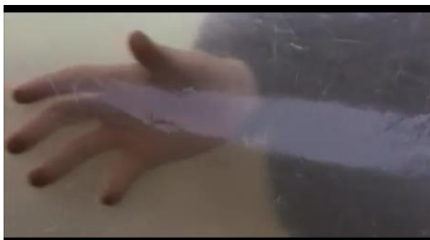
Imagem 40 - Mão (2004 - 1 01' 25") Fonte: La niña santa (2004)

Há também uma passagem no filme La niña santa que dá mais visibilidade e/ou sensibilidade ao exposto (imagens 40, 41, 42 e 43). Uma mão aparece deslizando por uma espécie de cortina plástica, como tapume que separa a área da piscina de sua entrada, ouvem-se os ruídos da água, de pessoas conversando, de todo o som ambiente daquele local; a mão é de Amalia, ela segue até o limite do tapume e começa a bater, de forma discreta, na estrutura metálica para chamar a atenção de Dr. Jano, que está dentro da piscina com os olhos fechados, logo ele percebe o som e procura de onde vem; Amalia segue detrás da cortina, o que se vê é somente seu contorno, quando ela se certifica de que o médico a viu, retira-se do ambiente. Os sons são muito nítidos, inclusive ouve-se o ruído de uma mosca e o som de um galo cantando, toda essa cena dá uma sensação tátil, a mão de Amalia passando pelo plástico e a expressão facial do Dr. Jano levam a uma percepção de toque naquilo que é proibido, de sentir a superfície tocada.