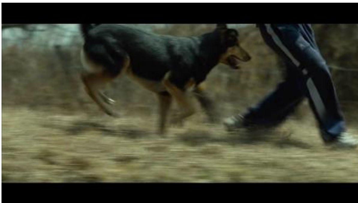
Imagem 20 - A visão de uma criança (2008 - 58") Fonte: La mujer sin cabeza (2008)

Este não é, porém, um recurso somente do filme citado; com a progressão das filmagens dos outros longas-metragens é possível identificar a mesma prática. Ademais da ideia de curiosidade, o uso de tal ângulo também sugere uma sensação de sufocamento, pois o enquadramento é fechado e não se tem a visão do todo. Da mesma forma que se inicia em La ciénaga , La mujer sin cabeza e La niña santa trazem o uso do mesmo recurso, também no começo.