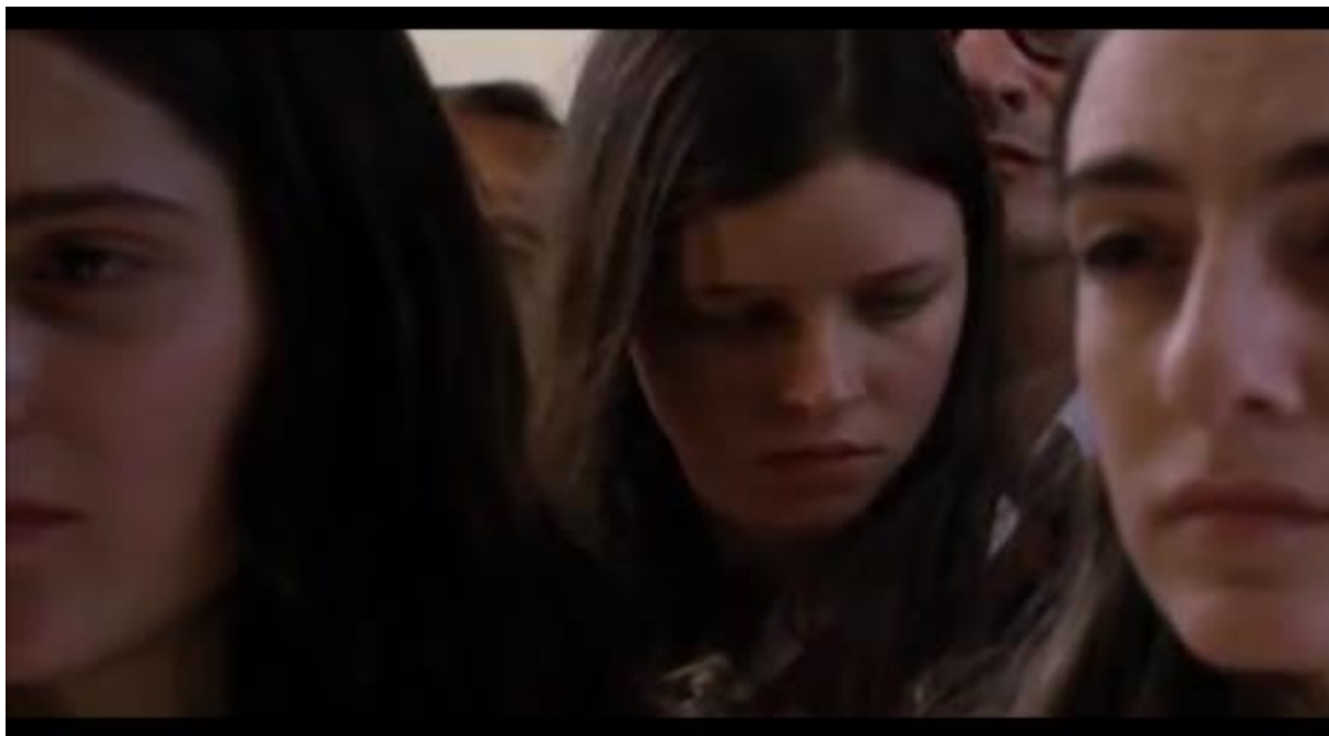
Imagem 56 - Olhar (2004 - 11' 02") Fonte: La niña santa (2004)

Sob a questão do ponto de vista, utilize-se como foco principal o Dr. Jano. O ponto de vista que Amalia apresenta é diferente do apresentado por sua mãe, ambas se relacionam com o médico, mas a forma como o veem influencia a opinião do espectador. A visão da jovem para o médico se apresenta de lado, ou detrás, é difícil encontrar uma cena frontal dos dois, olha-o de esgueira, como se fosse algo proibido.