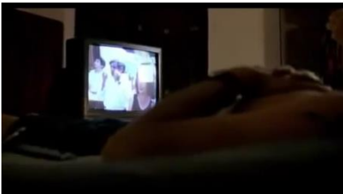
Imagem 77 - Televisão (2001 - )

Ao posicionar sua câmera em um local que não condiz muito com as disposições tradicionais, Martel quer mostrar ao espectador algo além do que se vê, sugere um olhar pessoal, uma opinião sobre a cena. Para conseguir o resultado, Lucrecia utiliza-se de signos e símbolos, simulacros capazes de construir a significação objetivada (imagens 77, 78, 79 e 80).