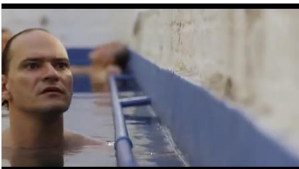
Imagem 43 - Assombro (2004 - 01 02' 32")