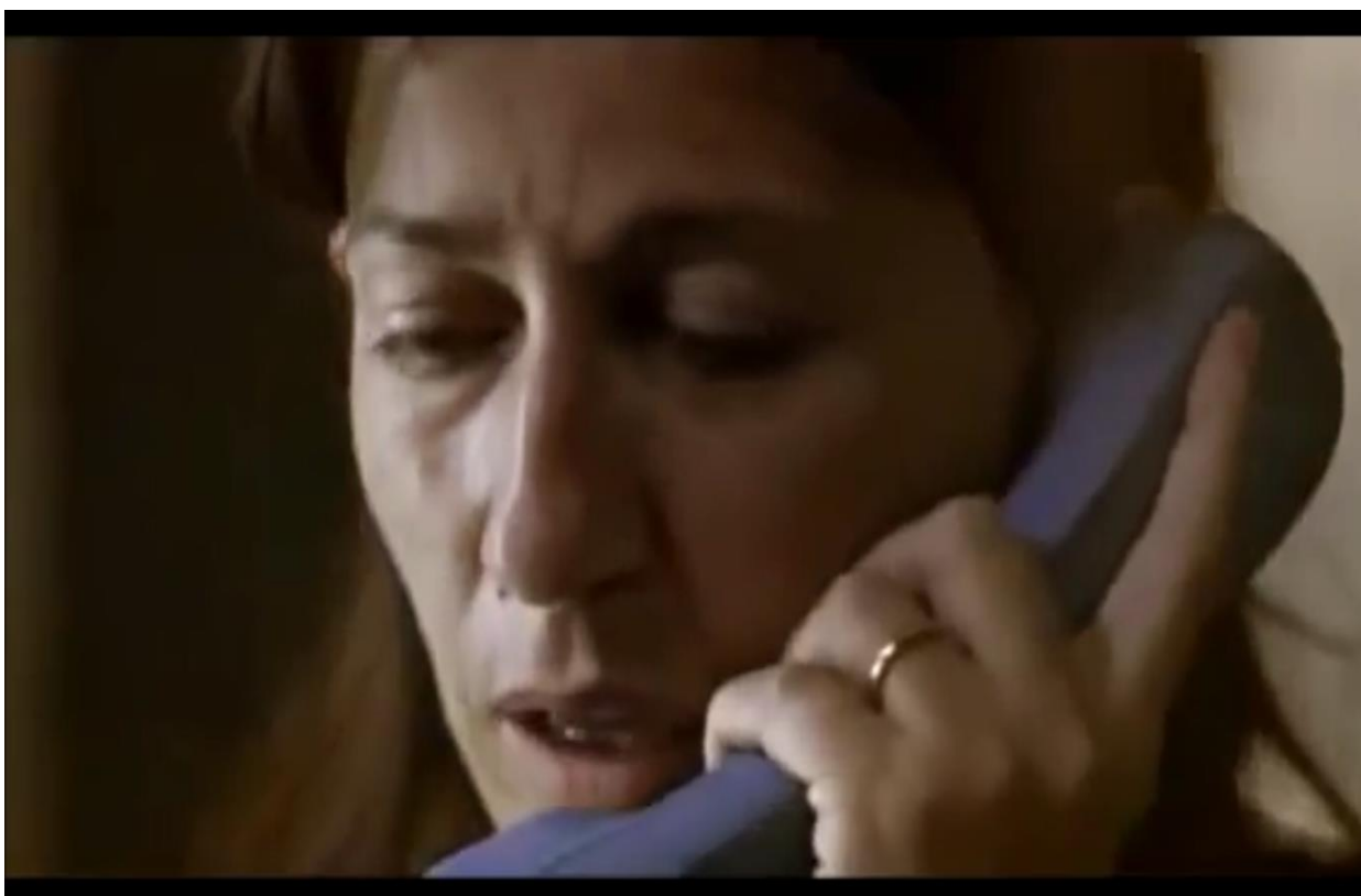
Imagem 7 - Tali (2001 - 10' 35") Fonte: La ciénaga (2001)