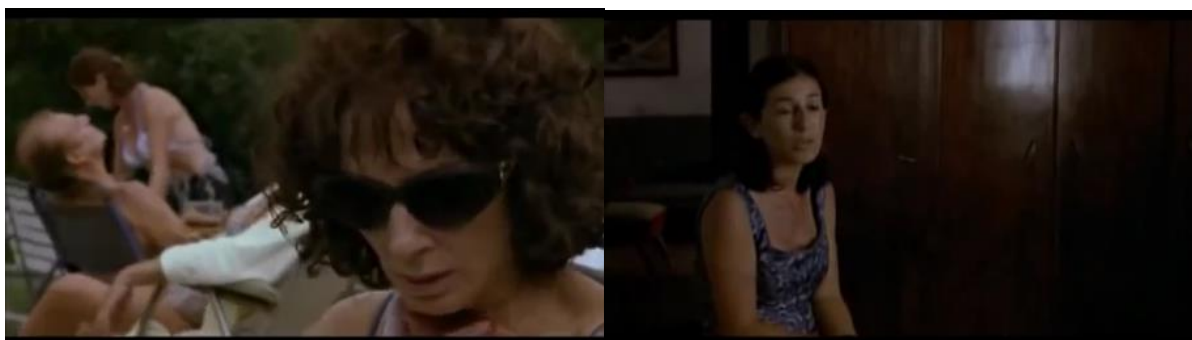
Imagem 47- Mecha 2 (2001 - 7' 36") Fonte: La ciénaga (2001)

Primeiro, sob o ponto de vista de Mecha; tem-se um narrador intradieгético, pois a própria personagem vai contando/mostrando os fatos que lhe envolvem. O segundo narrador é Tali, um intradieгético que observa para contar/mostrar a história de Mecha e sua família. Para conseguir isso, usa seu ponto de vista e sua história familiar a fim de, paralelamente, construir seu fio narrativo; da mesma forma funciona o narrador que está em Momi, também intradieгético e que usa seu ponto de vista para trazer a narrativa à tona. O terceiro narrador é o narrador primeiro , a câmera; ele é intra e extradieгético, oscilando de acordo com a necessidade narrativa.