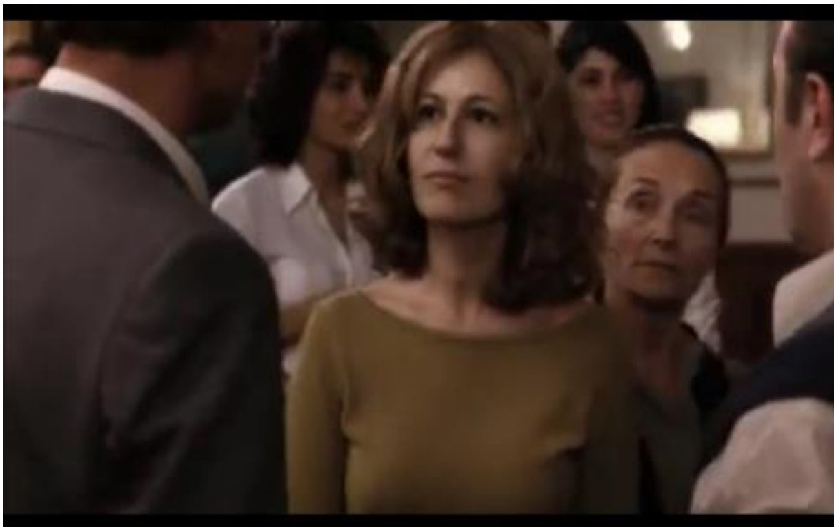
Imagem 58 - Olhar 3 (2004 - 25' 30") Fonte: La niña santa (2004)

Já o olhar de Helena se constrói de forma diferente. Desde o primeiro encontro as duas personagens se olham de frente, não há desvios de olhar tampouco sugestão de melindres ou algo parecido, não há problemas nesse direcionamento de olhar.