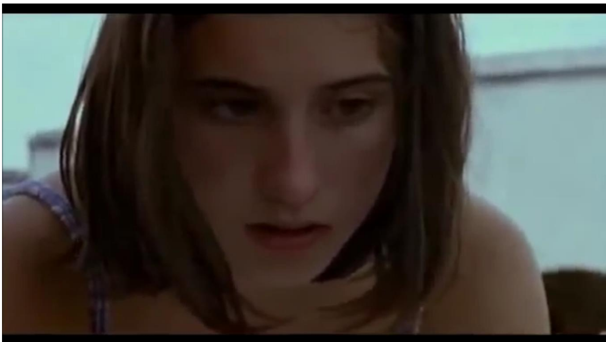
Imagem 8 - Momi (2001 - 06' 51")