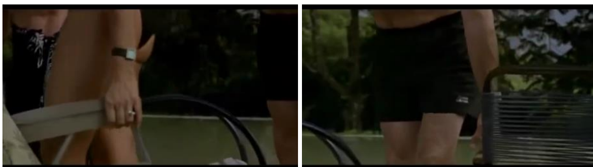
Imagem 19 - Cadeiras que se arrastam (2001 - 01' 16" e 01' 19") Fonte: La ciénaga (2001)

Nas cenas iniciais do primeiro longa-metragem da roteirista saltenha, a filmagem faz uso de um recurso que a cineasta afirma ser muito interessante, ela posiciona a câmera como se fosse o olhar de uma criança de nove ou dez anos, provocando uma visão curiosa do que é mostrado. (YOUTUBE, 2005) 53 . O narrador primeiro, como aqui foi denominado, a câmera propriamente dita, no início de La ciénaga , está exatamente nesta posição. (Imagem 19)