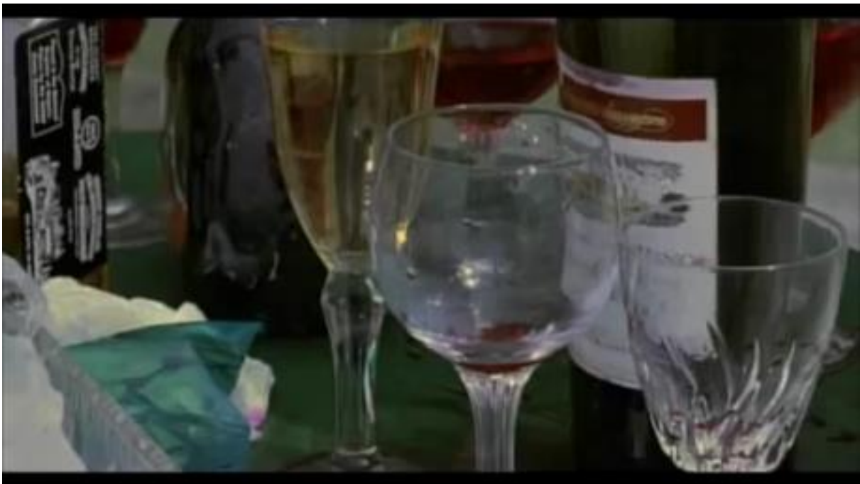
Imagem 24 - Bebidas (2001 - 39'') Fonte: La ciénaga (2001)

Na sequência, aparece uma mão feminina, que serve bebida e coloca gelo em um dos copos, ergue o braço, como se tivesse um trunfo ou troféu, fazendo um barulho de tilintar, parece que chamando, avisando que aquilo estava disponível. A cena posterior já mostra pessoas deitadas em espreguiçadeiras que, ao ouvirem o som do tilintar, começam a se mover letargicamente, como se hipnotizadas pelo barulho. A sensação que se tem é a de que são zumbis, pois os movimentos são lentos e descoordenados, arrastando suas cadeiras e indo em direção ao seu desejo (imagens 25, 26 e 27). Toda a parte inicial da narrativa, na obra, sugere um ar de filme de terror.