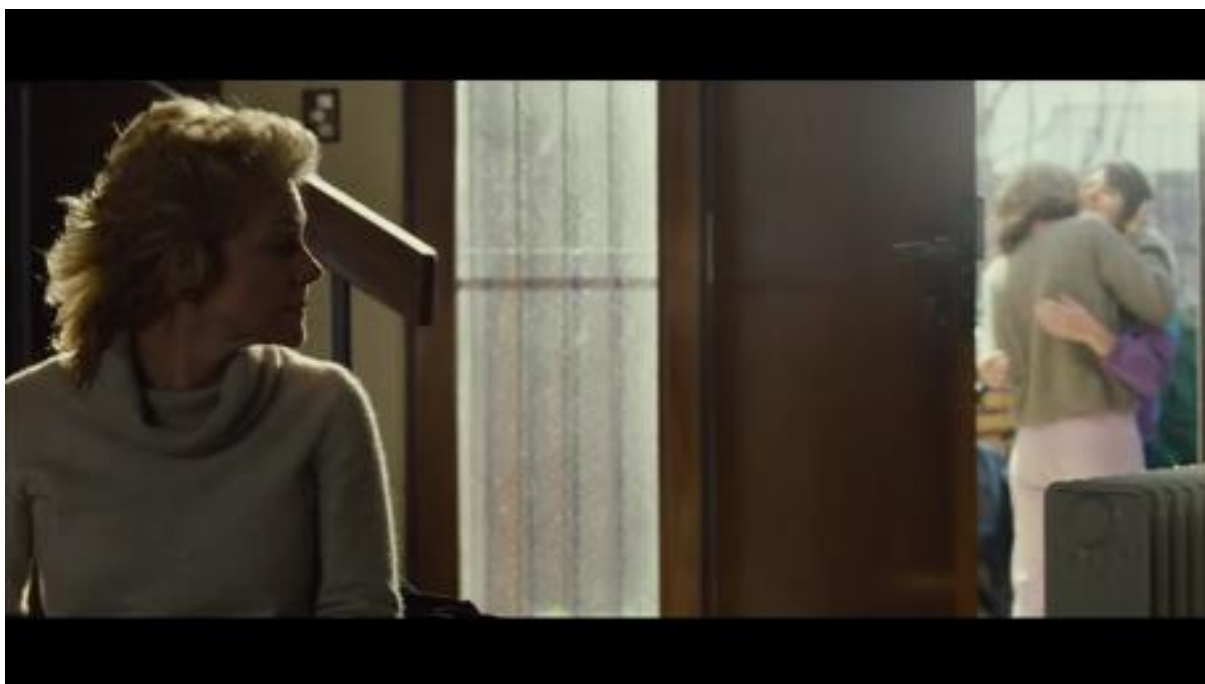
Imagem 37- Amigas (2008 - 31' 24")

girando a cabeça na direção da porta, que está entreaberta, mas não interessada, e a câmera focaliza tanto o ambiente interno como o externo. Na parte de fora, vê-se Candita abraçando a amiga de uma forma que sugere além da amizade, não há mais ninguém compondo esse quadro, portanto o narrador primeiro não faz parte da cena dramatizada, mas é o seu ponto de vista que sugere que Candita e a outra pessoa sejam mais que amigas.