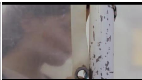
Imagem 41- Vulto (2004 - 1 02' 12")