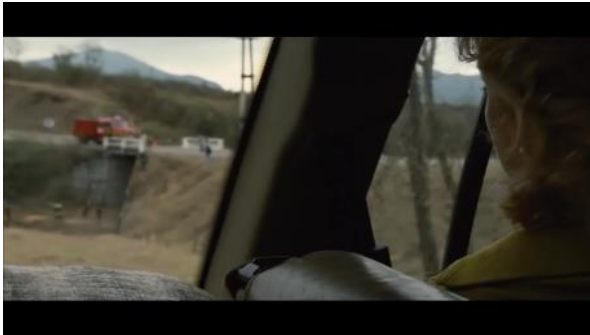
Imagem 68 - Bombeiros (2008 - 56' 43") Fonte: La mujer sin cabeza (2008)