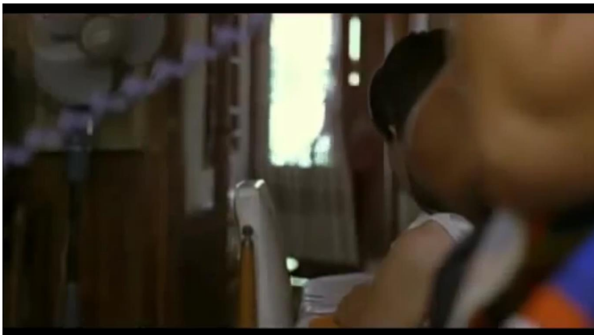
Imagem 13 - O que se vê? (2001 - 10' 04") Fonte: La ciénaga (2001)

No cinema de Lucrecia, há o abandono da centralidade dos elementos visuais, o que é marca fundamental da estrutura hollywoodiana. De fato, a cineasta ataca o estilo citado criando novos contextos e expectativas, dir-se-ia, até, que cria um estilo próprio de filmagem. O primeiro longa-metragem - La ciénaga -, em seu início, logo aos dez minutos, apresenta uma cena, na casa da personagem Tali, em que a câmera está posicionada de forma que, praticamente, toda a imagem mostrada está fora de foco. O espaço, em sua maioria, está fragmentado, descentralizado, situação também encontrada na imagem 13.