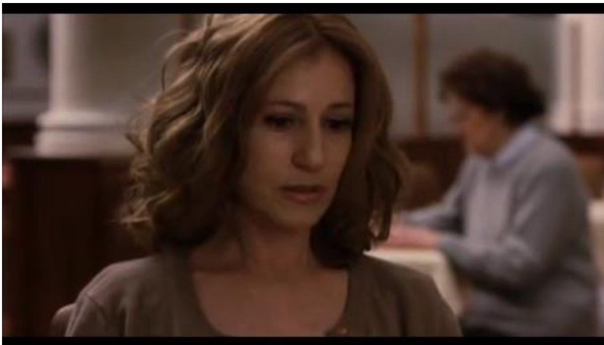
Imagem 10 - Helena (2004 - 09' 08") Fonte: La niña santa (2004)

adolescente que estuda em uma escola religiosa e que tem uma amizade muito próxima a outra garota; ambas passam por uma fase de descobertas e iniciação sexual.