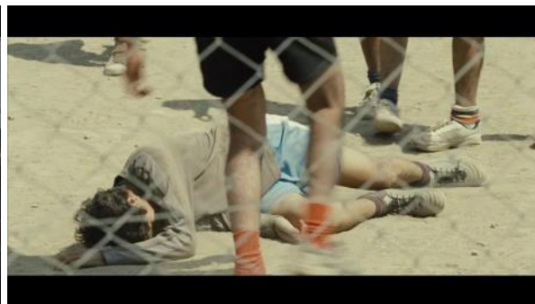
Imagem 65 - Menino (2008 - 37' 47'')

Como Verô não desceu do carro para prestar socorro ao atropelado, ela não sabia o que havia se chocado contra o veículo. O narrador primeiro, com seu poder de direcionar o olhar do espectador, joga com a possibilidade de ter sido um animal ou uma pessoa. Verónica encontra-se nessa constante alternância de sua vítima (imagens 64 e 65). Ninguém sabe o que ocorreu, exceto ela, portanto todos os outros fios narrativos tratam de assuntos que estão indiretamente relacionados ao acidente. A ida ao vendedor de vasos e a falta de um funcionário (imagem 66), a parada à beira da estrada para pegar o tênis do sobrinho que foi atirado pela janela e a presença do canal cheio d'água (imagem 67), a passagem pelo resgate de alguma coisa no canal pelos bombeiros (imagem 68), a presença fantasmagórica de imagens de crianças (imagem 69), tudo remete ao acidente, mas não de forma clara e objetiva.