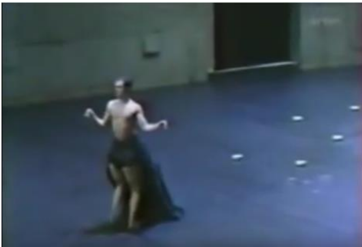
Imagem - 2 - Minotauro

alguns corpos. Há referência a outras linguagens artísticas, é possível identificar elementos cênicos, dança, música; e, para retornar à questão da falta/presença de historicidade e retorno ao passado, que Jameson e Hutcheon se referem, é possível identificar que a coreógrafa se apropria de elementos da mitologia para sua composição. Na imagem abaixo, os atores/dançarinos, fazem alusão ao minotauro.