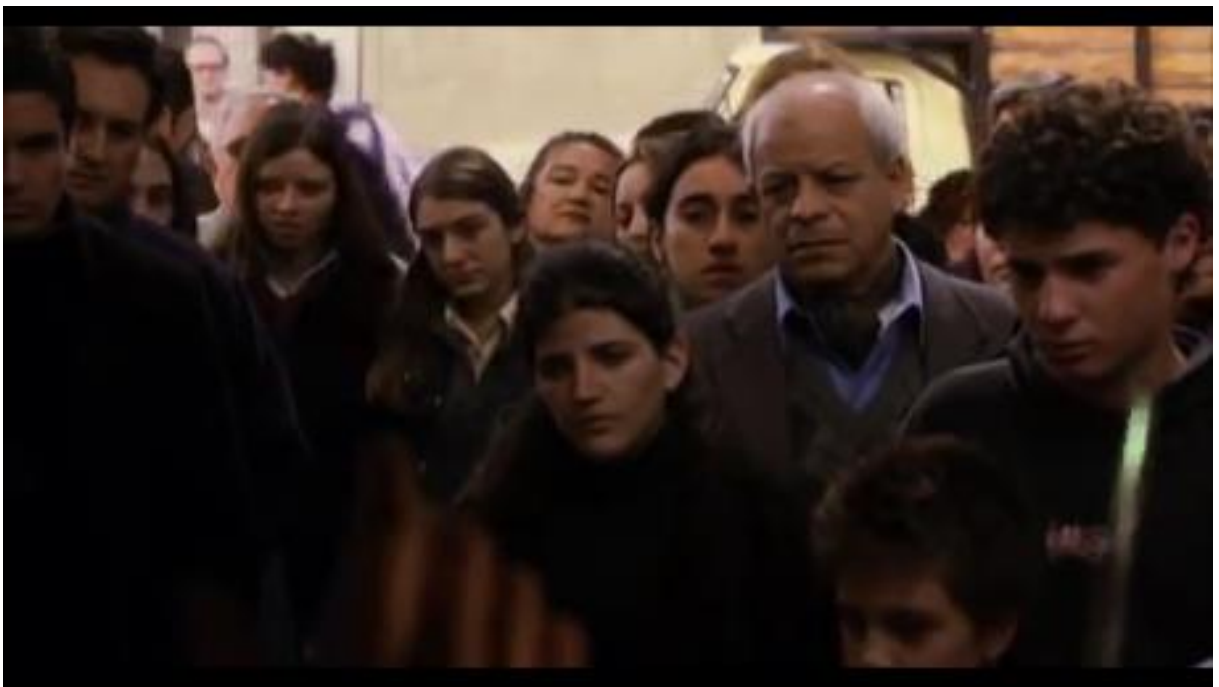
Imagem 17- Transeuntes (2004 - 10' 06")

La mujer sin cabeza , por sua vez, apresenta esse ambiente claustrofóbico ao criar uma diegese que, em alguns momentos, dá a impressão de ocorrer dentro da cabeça da personagem Verô. A heterogeneidade, incluída como arcabouço do pós-modernismo, se faz presente no longa-metragem em vários momentos. A personagem principal, após o acidente que sofre, vê-se perdida na sociedade pós-moderna, toda