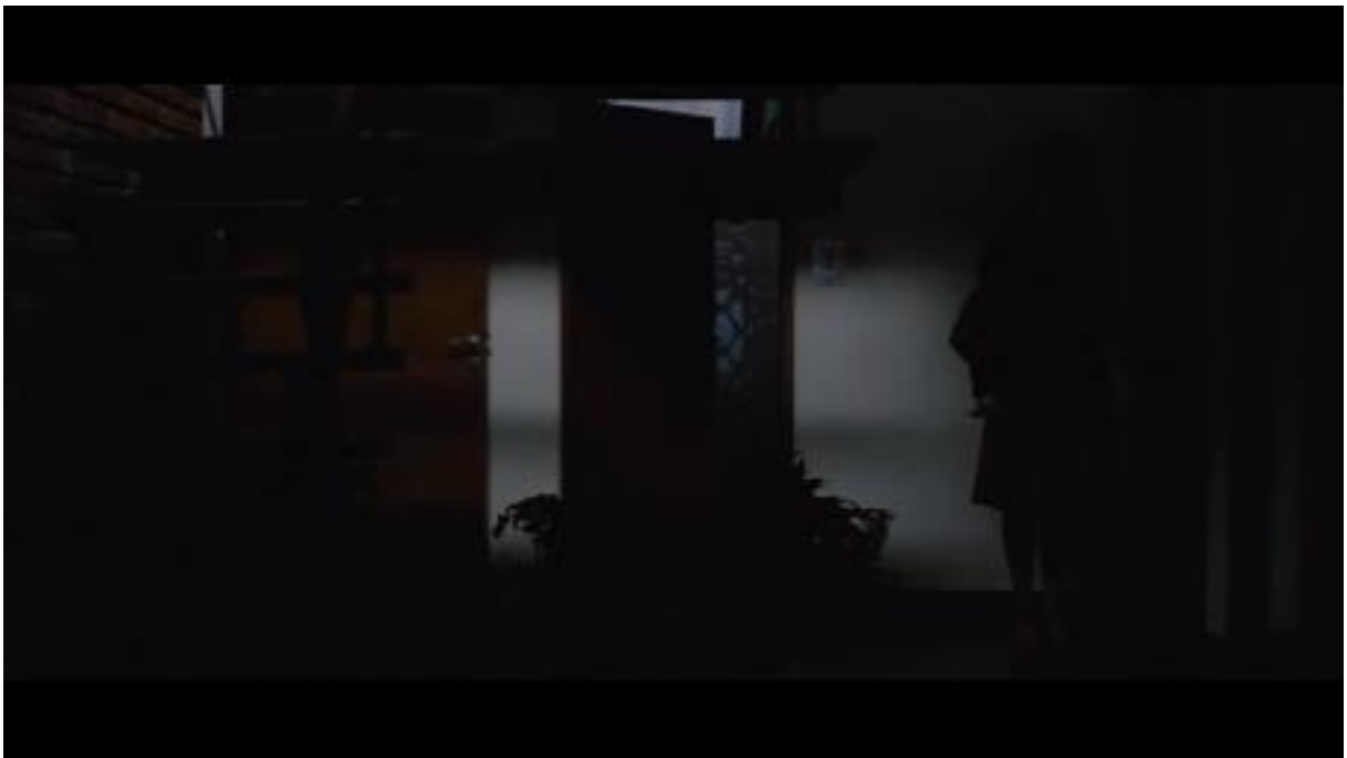
Imagem 80 - Escuridão (2008 - 18' 45") Fonte: La mujer sin cabeza (2008)

Em La niña santa , a influência do ponto de vista segue por um caminho tátil. Na imagem acima, a impressão que se tem é que, além da mão do Dr. Jano, a mão do espectador também poderá tocar a menina. Mais uma vez a câmera induz a percepção de quem vê a cena. Ademais de não ser uma imagem rápida, ela demora, do início ao fim, vinte e oito segundos, intercalado por uma segunda imagem (imagem 78), em que ambas as personagens são focalizadas de costa, exatamente no mesmo ângulo que Jano via a jovem, como se o espectador fosse alguém que estivesse atrás de médico, fazendo a mesma coisa que o doutor fazia em Amalia .