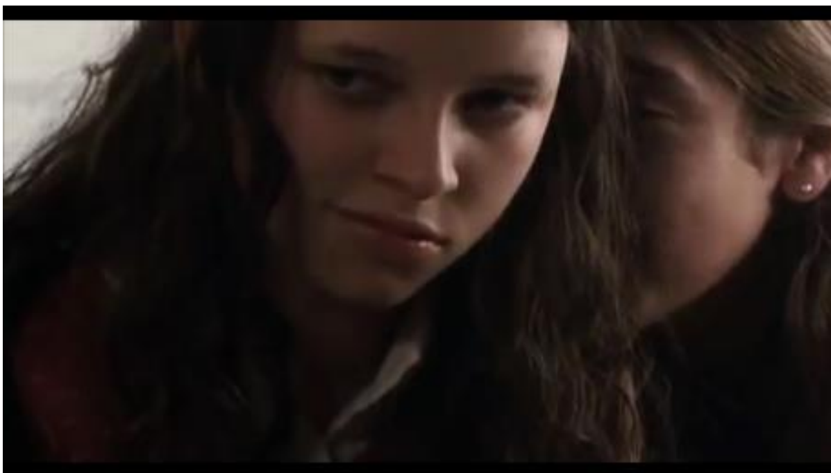
Imagem 11 - Amalia (2004 - 07' 43") Fonte: La niña santa (2004)

A constituição da identidade dessas duas personagens, mãe e filha, está marcada pela presença dos valores sociais vigentes naquela sociedade na qual se desenvolve a trama. A cineasta não faz questão de determinar esse local, não há