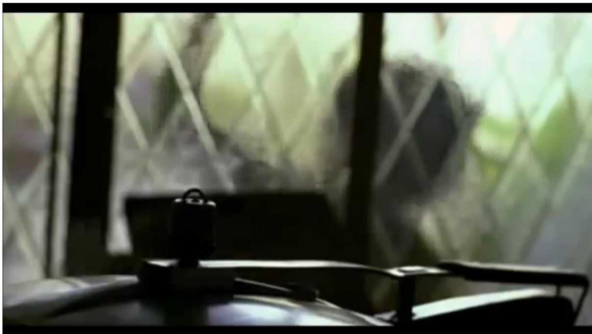
Imagem 14 - Panela de pressão (2001 - 10' 15") Fonte: La ciénaga (2001)

pouco antes de encontrar Luciano, a câmera mostra uma panela de pressão em funcionamento e uma imagem disforme por detrás da porta de vidro, mais uma vez, reforçando a ideia de que a imagem definida não é o foco de sua filmagem.