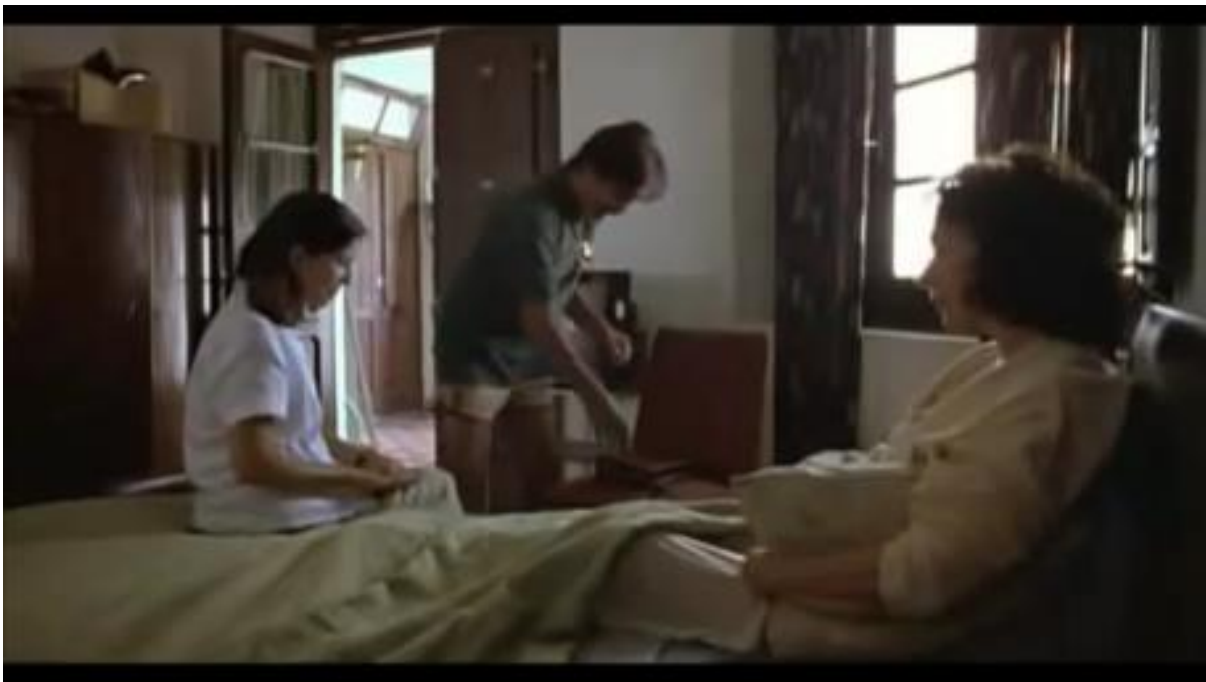
Imagem 75 - Porta aberta (2001 - 01 05' 34") Fonte: La ciénaga (2001)

Há, ainda, as cenas dos ambientes em que aparecem outras aberturas, uma porta que dá para outra porta (imagem 75) ou corredores com várias opções de portas (imagem 76).