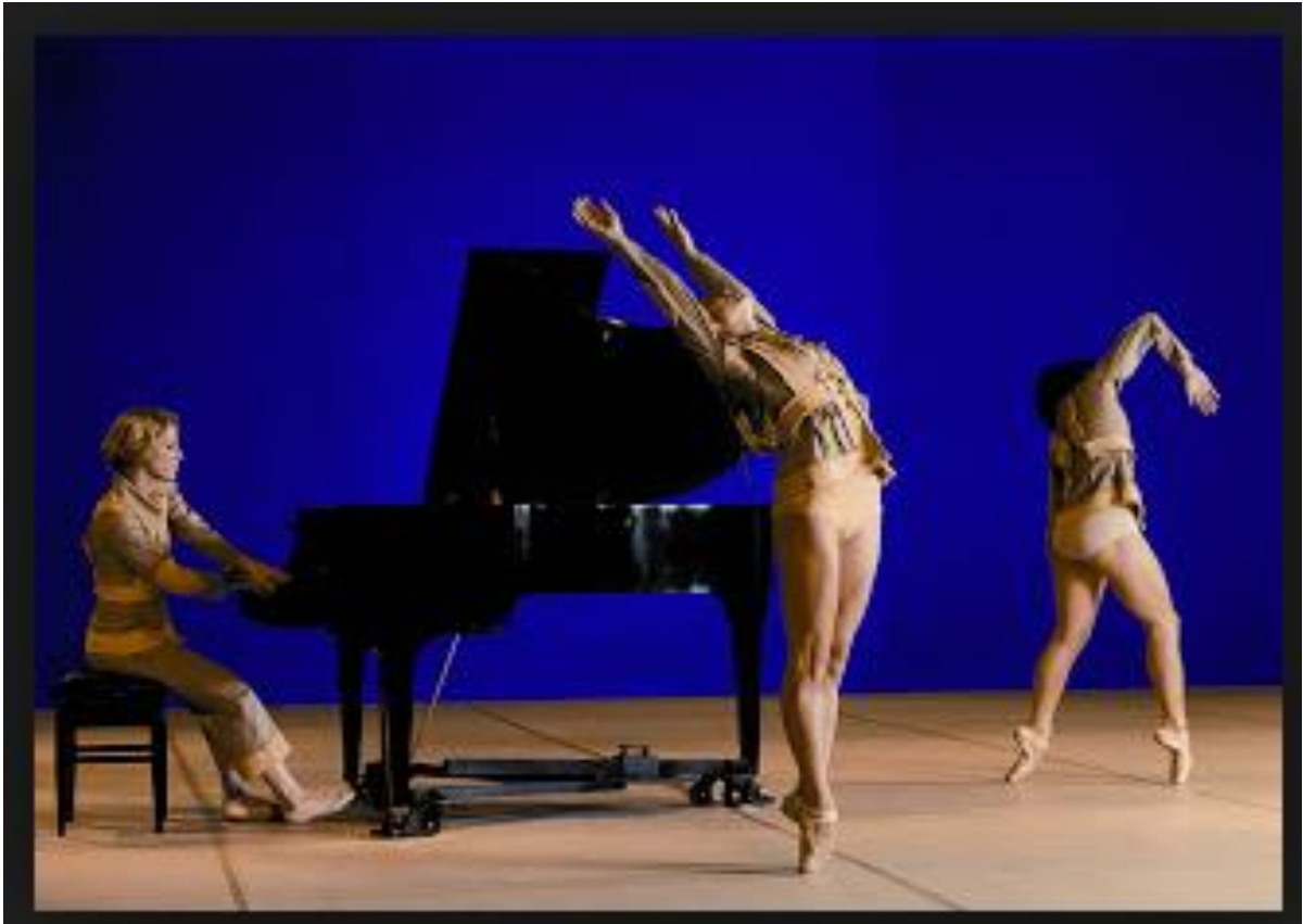
Imagem 4 - As meninas

A arte pós-moderna é marcada por uma concepção mutável, um pensamento plural, sentido parcial e abrangente; em suma, abalizado por contradições. (HUTCHEON, [1988] 1991). Portanto, termos como homogêneo , igual e total não cabem mais na atualidade, com isso, o discurso hegemônico de totalidade, proferido pelo centro, perde seu valor e o ex-cêntrico ou o descentralizado começa a se sobressair. Essa mudança no pensamento e na visão do mundo além Europa nada mais é que se enxergar como realmente se é, um grande grupo de minorias; é saber que a cultura Americana e, mais especificamente ainda, a Latino Americana não é uniforme, simétrica, nem mesmo análoga à cultura europeia.