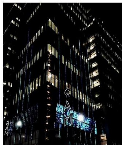
Imagem - 5 - Mirror

Se esse é um período marcado pela quebra das totalizações, das unidades, o sujeito, a sociedade, estão compostos por porções de outros sujeitos. Então, legitima-se a presença do outro na formação das identidades pessoais e sociais: