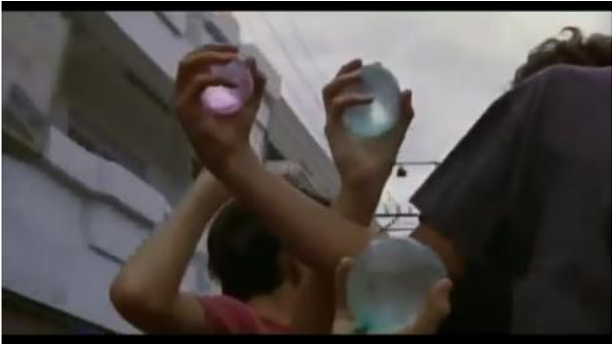
Imagem 28 - Balões d'água (2001 - 09' 32") Fonte: La ciénaga (2001)