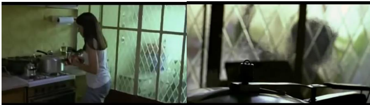
Imagem 45 - Pressão 1(2001 - 11' 50")

momentos diferentes; aparentemente é um objeto que não suscita muita reflexão sobre o mesmo, porém, se considerar toda a história que rodeia a vida de Tali, esse objeto remete a condição psicológica que a personagem se encontra, pois ela está a ponto de explodir por conta de todos os problemas rotineiros pertencentes a uma mãe e dona de casa, oprimida pelo marido.