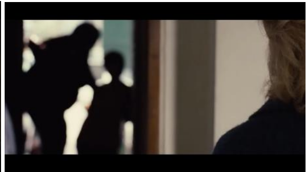
Imagem 69 - Fantasmas (2008 - 36' 16)

Em todas essas imagens, o ponto de vista utilizado retrata a mente e a visão de Verô. Lucrecia se utiliza dos vários pontos de vista apresentados pelos diversos narradores para construir essa diegese imersa no estado mental de sua protagonista. Ao utilizar uma das personagens, Tia Lala (imagem 70), com mal de Alzheimer, demonstra uma forma de representação, um simulacro da perda da capacidade de raciocínio e a associação com o mundo real.