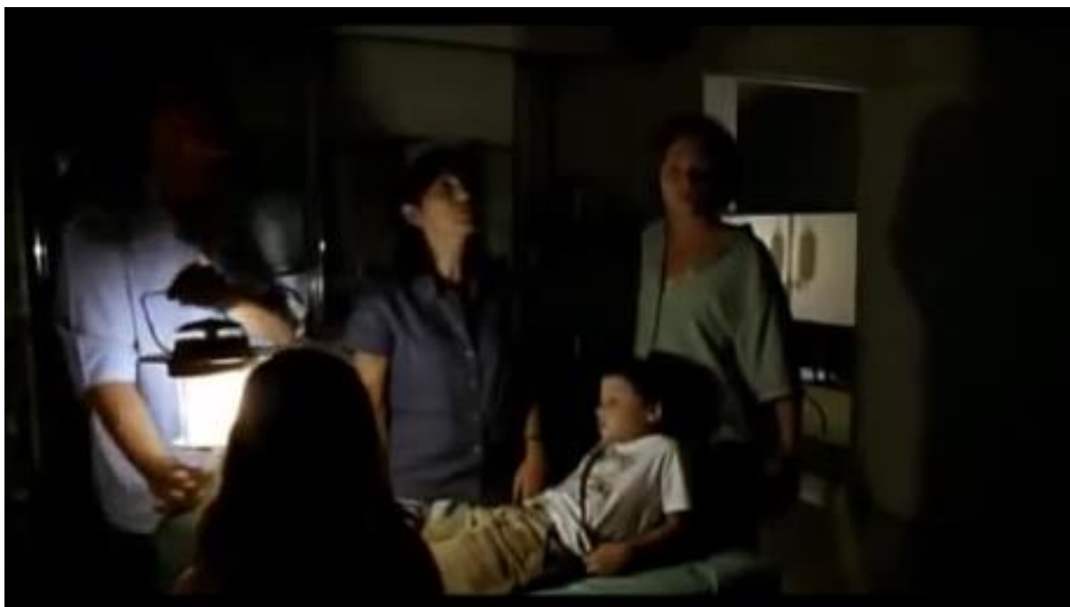
Imagem 44 - Hospital (2001 - 15' 30") Fonte: La ciénaga (2001)

O uso sensorial também ocorre no primeiro filme, La ciénaga , ainda no início. Luciano sofre um pequeno corte na perna e é necessário ir até o hospital. Como já exposto, é época de carnaval e, portanto, verão, estação quente e úmida. Na cena (imagem 44) em que estão no hospital e Luciano está sendo atendido, acaba a luz, várias pessoas aparecem na cena, ouvem-se ruídos de trovões e chuva. A sensação vivenciada nessa cena é de um calor abafante, o ambiente se torna apertado, claustrofóbico, sente-se sufocado.