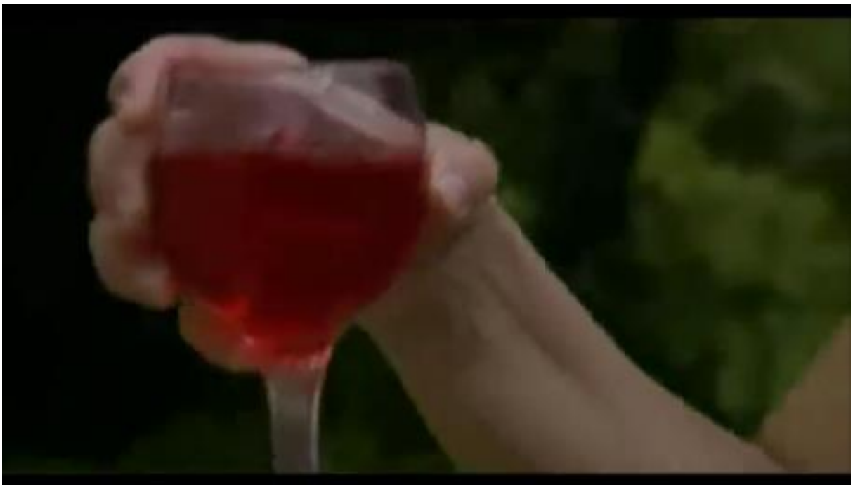
Imagem 26 - O trunfo (2001 - 52") Fonte: La ciénaga (2001)