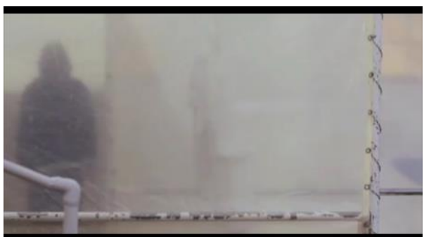
Imagem 42 - Vulto 2 (2004 - 01 02' 23") Fonte: La niña santa (2004)