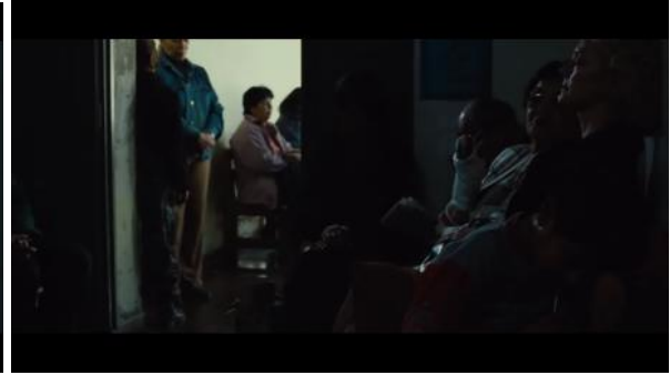
Imagem 62 - Atendimento (2008 - 09' 41")

Na cena do Raio-X não há diálogo, pois ali está somente Verô, contudo, ouve-se uma fala “a senhora está dormindo”, esta conversa faz parte da próxima cena (imagem 62) em que uma mulher que aguarda atendimento fala a outro paciente. A situação de fala que se adianta à imagem é característica do pensamento e é mais um artifício para representar a condição psíquica da personagem principal. Não se pode deixar de citar que, mais uma vez, é uma cena no escuro, que se vê somente os contornos das pessoas e dos objetos, o que não deixa de sugerir que é assim que a cabeça de Verô se encontra, na penumbra, situação que se repete muitas vezes na primeira parte do filme.