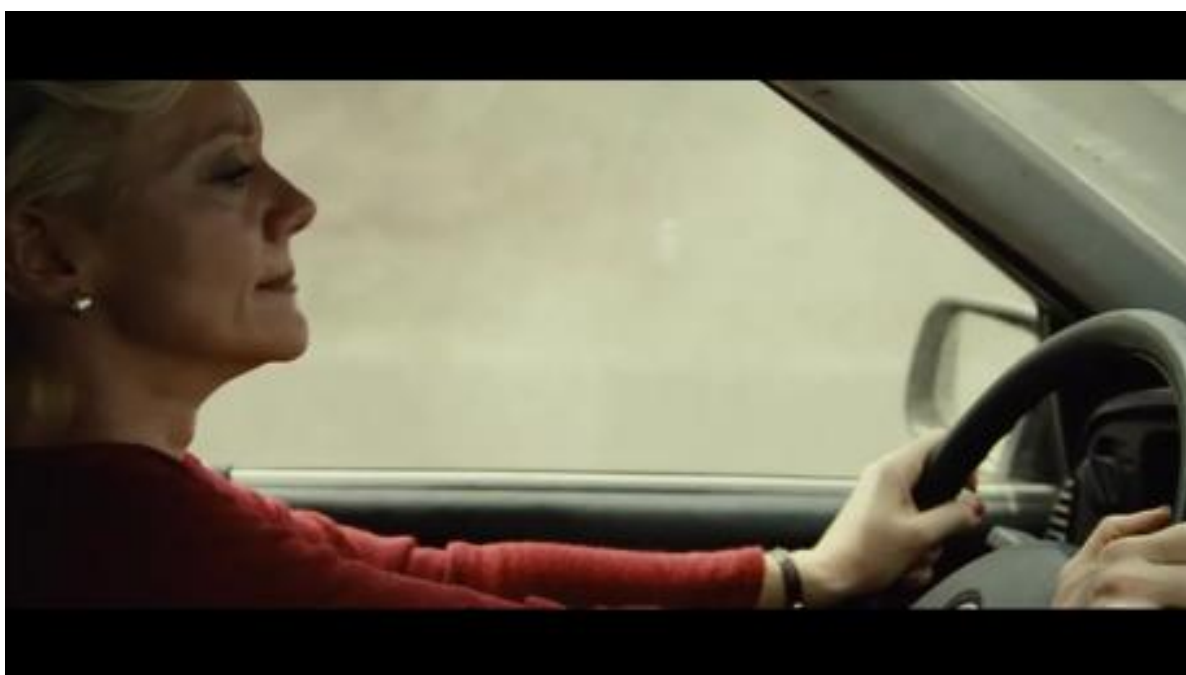
Imagem 12 - Verô (2008 - 04' 47") Fonte: La mujer sin cabeza (2008)

La mujer sin cabeza , terceira obra da cineasta saltenha, apresenta uma única personagem central, Verô (imagem 12), uma mulher que já passou da meia idade, dentista e participante da classe média alta, casada e mãe de duas filhas. Personagem com as marcas pós-modernas mais salientes. Verônica, após atropelar algo , entra em crise psicológica; a fragmentação e contradição de sua identidade conduzem toda a narrativa. Ela passa a habitar um local em que as fronteiras de sua subjetividade, assim como do real e irreal, perdem a precisão.