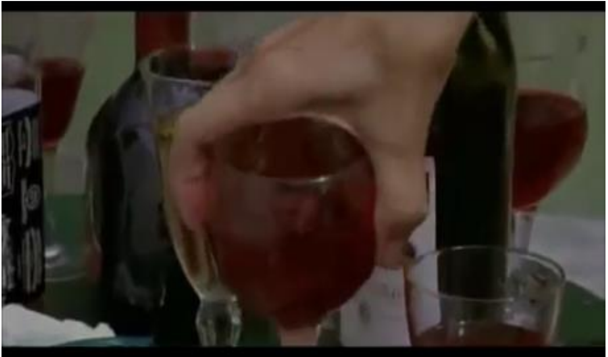
Imagem 25 - A mão (2001 - 51") Fonte: La ciénaga (2001)