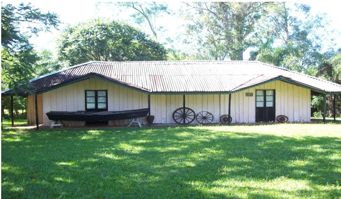
Casa de Horacio Quiroga em Misiones , Argentina – réplica da casa que foi construída pelo escritor. 74